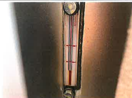
×：上部旋回体 作動油タンク・作動油