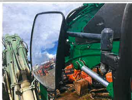
◎ : 安全装置 後写鏡