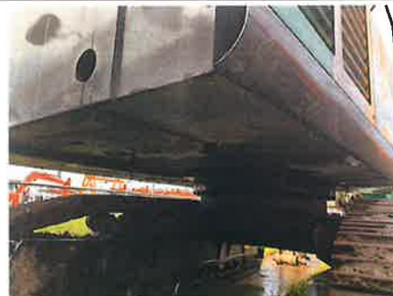
○：上部旋回体 カバー類