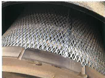
②：エンジン エアクリーナ