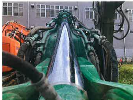
◎：フロント アームシリンダ