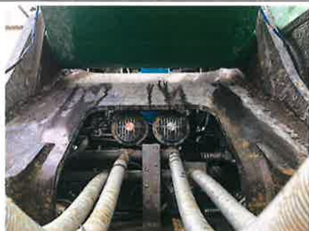
◎ : 安全装置 警報機