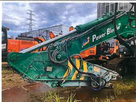
◎：フロント 油圧配管・ホース