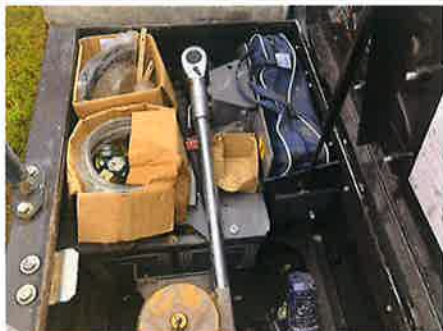
①：エンジン バッテリー