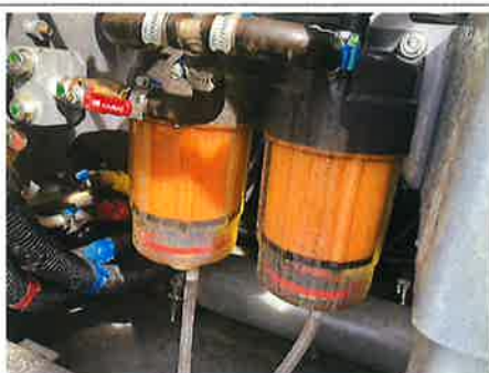
⑤：エンジン 燃料ライン