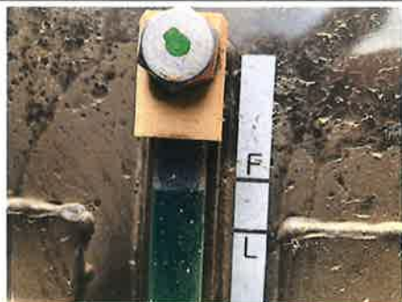
◎ : エンジン 冷却水