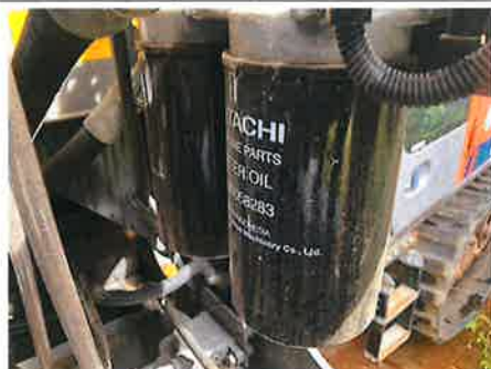
○：エンジン エンジンオイル