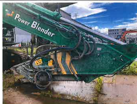
◎：フロント 油圧配管・ホース