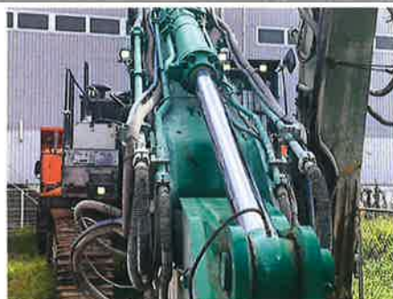
◎ : 安全装置 灯火装置