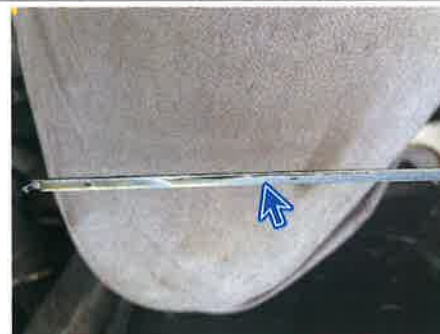
○：エンジン エンジンオイル