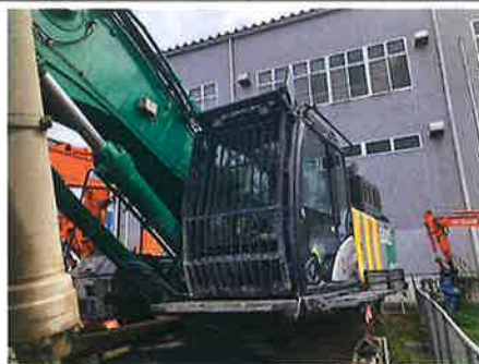
◎ : 安全装置 ヘッドガード