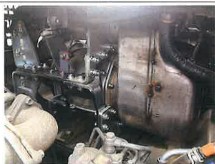
④：エンジン マフラー