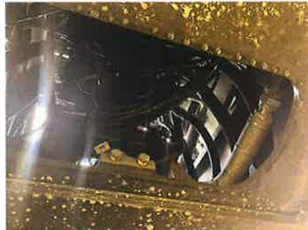
○：上部旋回体 其他油圧機器