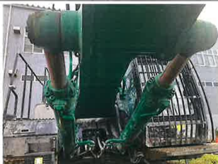
◎：フロント ブームシリンダ