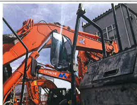
◎ : 安全装置 後写鏡