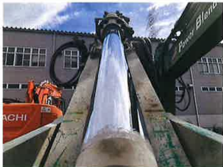
◎：フロント バケットシリンダ