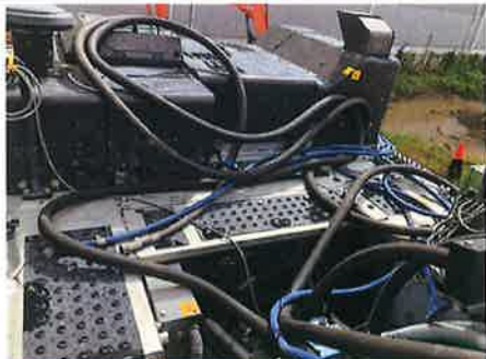
○：上部旋回体 其他油圧機器