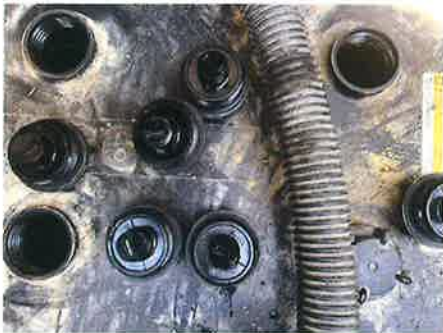
○ : エンジン バッテリー