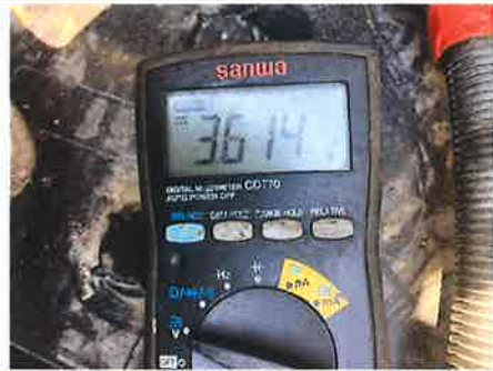
× : エンジン バッテリー