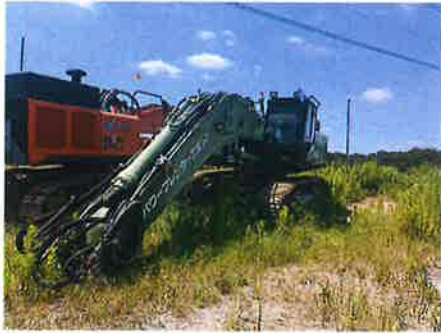
① : 全体