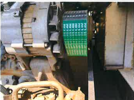
○ : エンジン ファンベルト・ACベルト