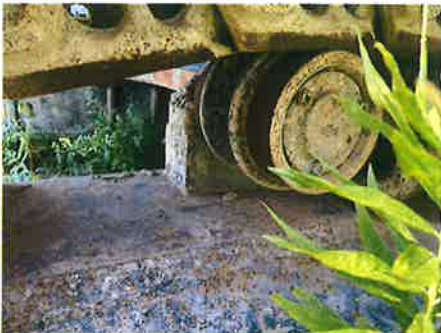
③ : 下部走行体 上部ローラー