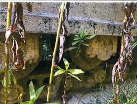
⑤ : 下部走行体 下部ローラー