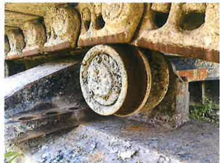
④ : 下部走行体 上部ローラー