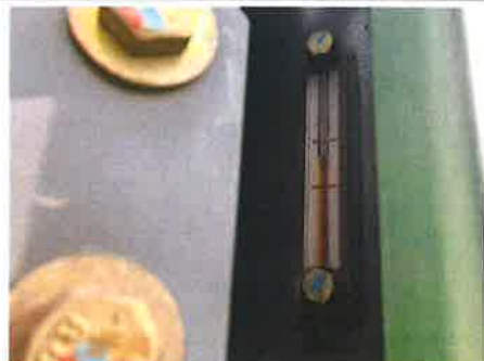
◎ : 上部旋回体 作動油タンク・作動油