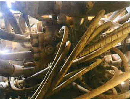
◎ : 上部旋回体 その他油圧機器