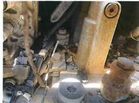
◎ : 上部旋回体 その他油圧機器