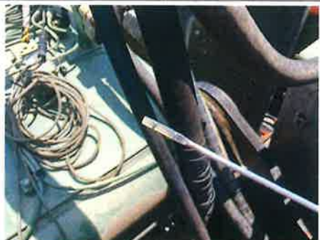
⑥ : 上部旋回体 旋回装置