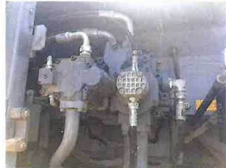
◎ : 上部旋回体 ポンプ装置