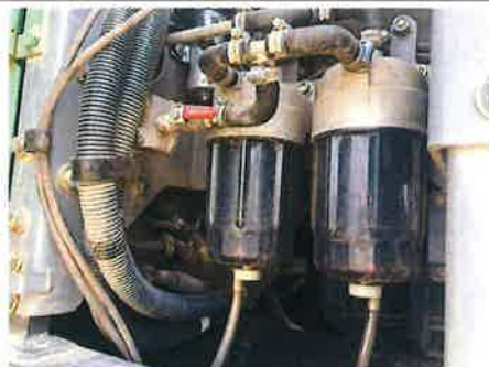
○ : エンジン 燃料ライン