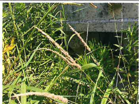
⑥ : 下部走行体 下部ローラー