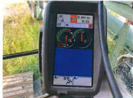
④ : アワーメータ