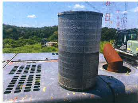
○ : エンジン エアフィルター