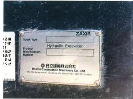
② : 号機銘板