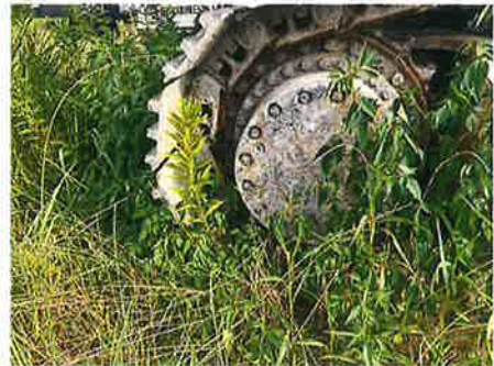
② : 下部走行体 走行装置