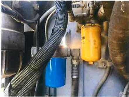
① : 上部回転体 作動油タンク、作動油