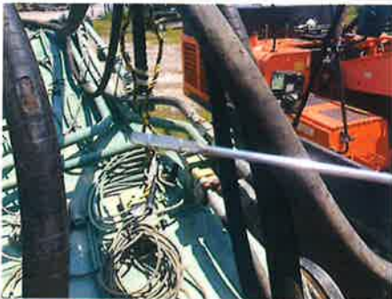
⑤ : 上部旋回体 旋回装置