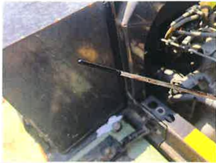
○ : エンジン エンジンオイル