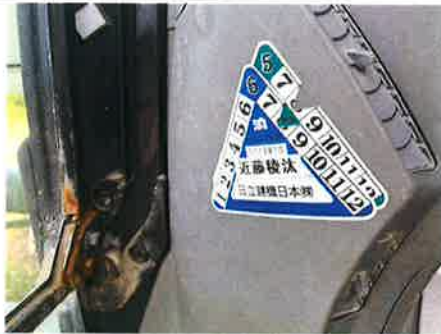
③ : 検査証