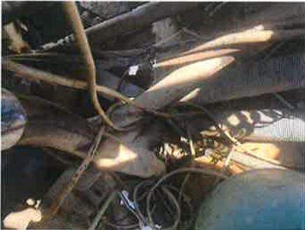
◎ : 上部旋回体 その他油圧機器